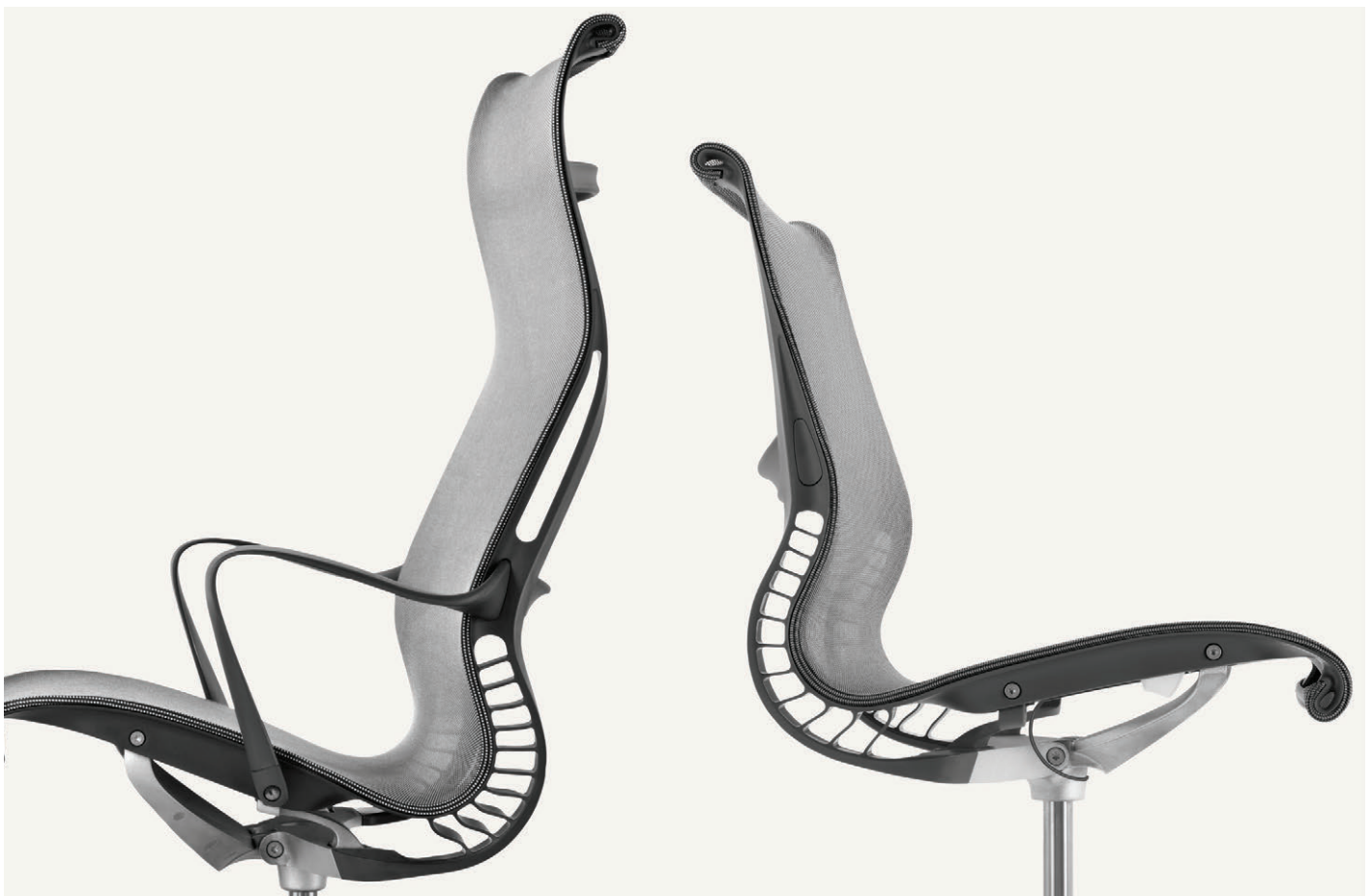
Die Vielseitigkeit des Kinematic Spine ermöglicht noch mehr verschiedene Haltungen beim Sitzen. Beim Setu Lounge-Stuhl können Sie die ideale Position beim Zurücklehnen finden, ohne etwas verstellen zu müssen.